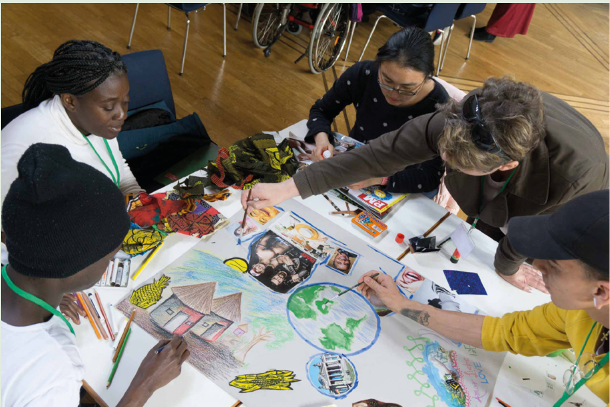
Abbildung 3 Gemeinsames Gestalten der Welt

Die rechtliche Situation für Incoming-Freiwilligendienste bzw. für Freiwillige, die aus dem Ausland und insbesondere aus so genannten Drittstaaten nach Deutschland kommen, ist wie dargestellt nicht bzw. nur ansatzweise geregelt (s. Kap 3.1, Absatz 2). In keinem der genannten Rechtsgrundlagen (außer dem Visahandbuch) sind internationale Freiwillige explizit genannt. Daher hat es sich der der Fachbeirat zur Aufgabe gemacht, die folgenden Empfehlungen zur rechtlichen und inhaltlichen Ausgestaltung von Incoming-Freiwilligendiensten zu formulieren.