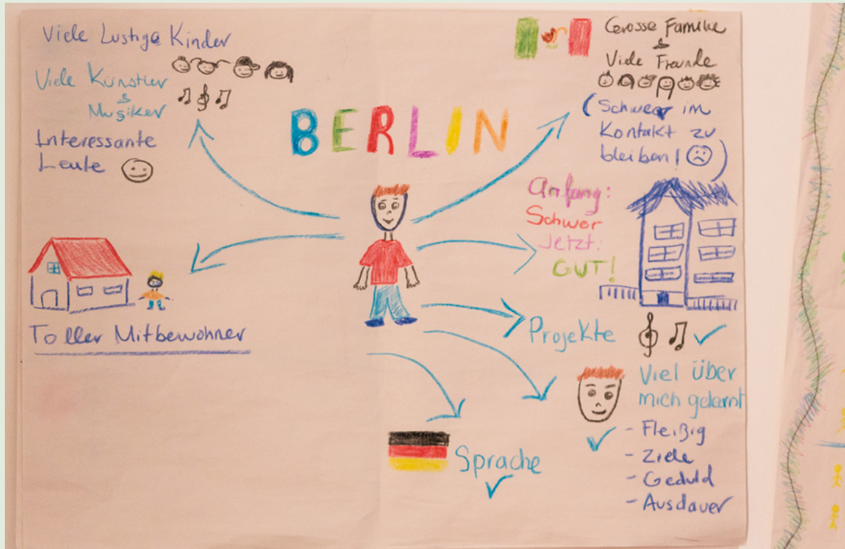
Abbildung 1 Incoming als Lern- und Qualifizierungsdienst zur Persönlichkeitsentwicklung – Plakat einer Freiwilligen bei einer Zwischenreflexion