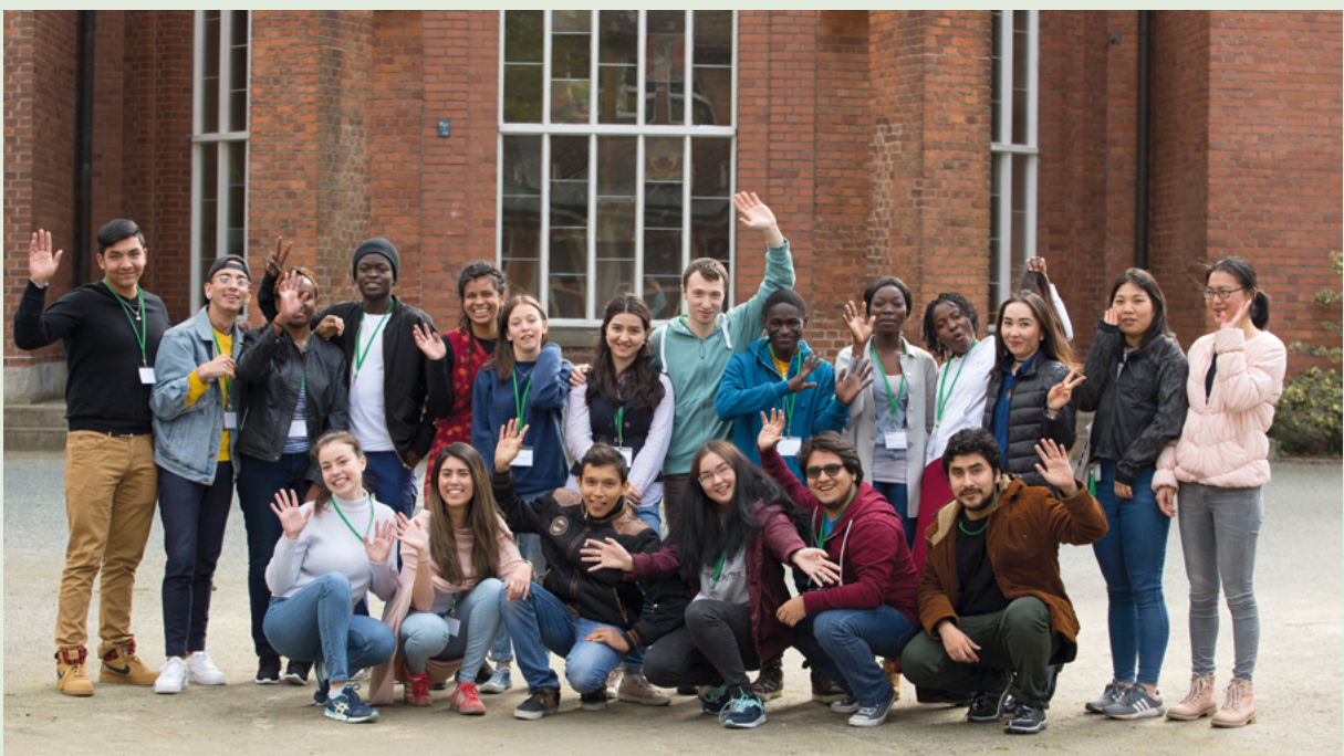
Abbildung 2 Der zweite Jahrgang der INGLOS Freiwilligen