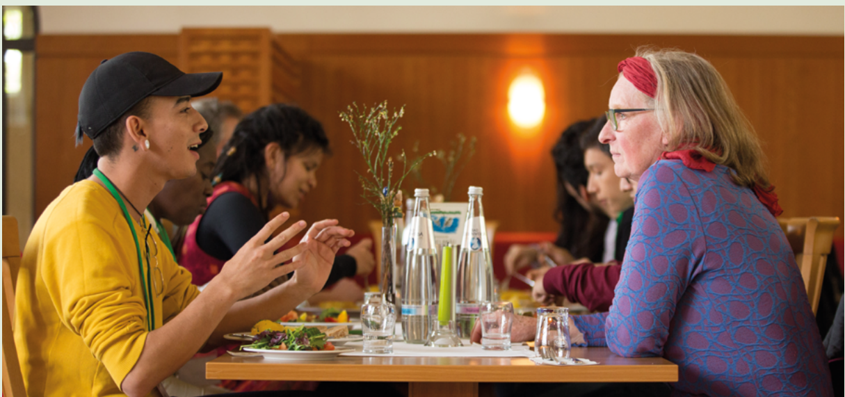
Abbildung 4 Austausch und Blick über den eigenen Tellerrand